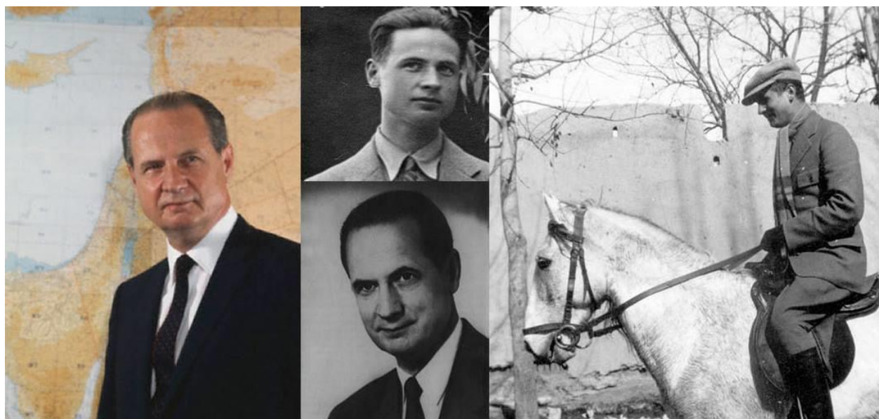
Diplomaten och FN-medlaren som en gång var ung doktorand och red över Pamir till fältarbete bland uigurerna i Xinjiang.

Några år senare kom jag i kontakt med Jarring igen, sedan jag blivit invald i forskningsinstitutets styrelse och bland annat hjälpte till med redigeringen av turkspråkiga texter till dess årsskrift. Jag minns hur imponerad jag var av Jarrings kulturhistoriska kunskaper. En gång satt vi på Kungliga Biblioteket i Stockholm och gick igenom en artikel med turkiska gåtor. Tankenöten "Jag har en höna som lägger ägg på grannens åker" var ingenting konstigt för honom. Däremot tycktes han bli förvånad över min okunnighet om hur pumpaplantor kan breda ut sig.