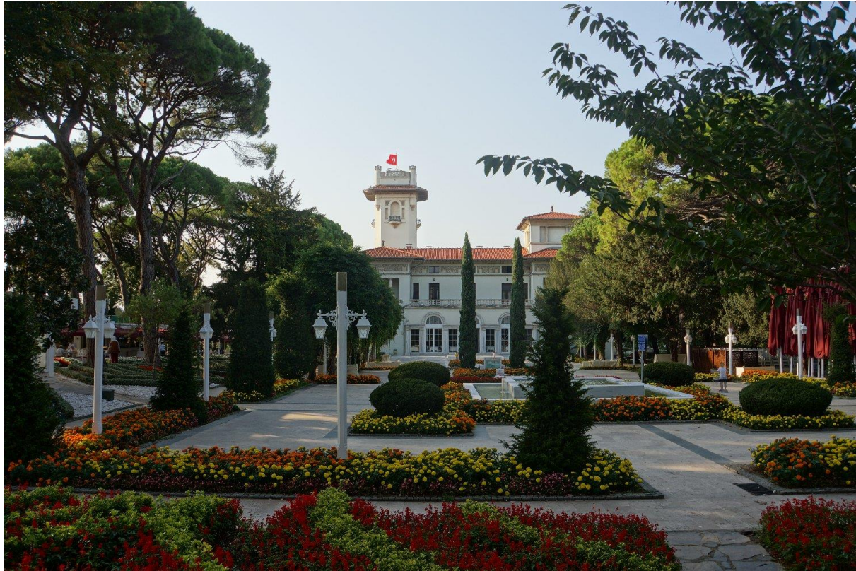
Khedivens palats, byggår 1907.

konungsliga salongerna. Entrén leder in till en marmorrondell i antik romersk stil med kolonner och en hög fontän i mitten.